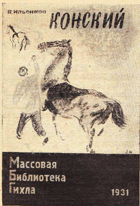
Обложка худ. Д. Шмаринова

В плане «Массовой библиотеки» основное место занимают заводские темы, затем колхозные, есть в плане и вещи по вопросам гражданской войны, Красной армии, о положении рабочего класса и революционном движении до революции в России и вне ее, есть книги на тему современного революционного движения за рубежом.