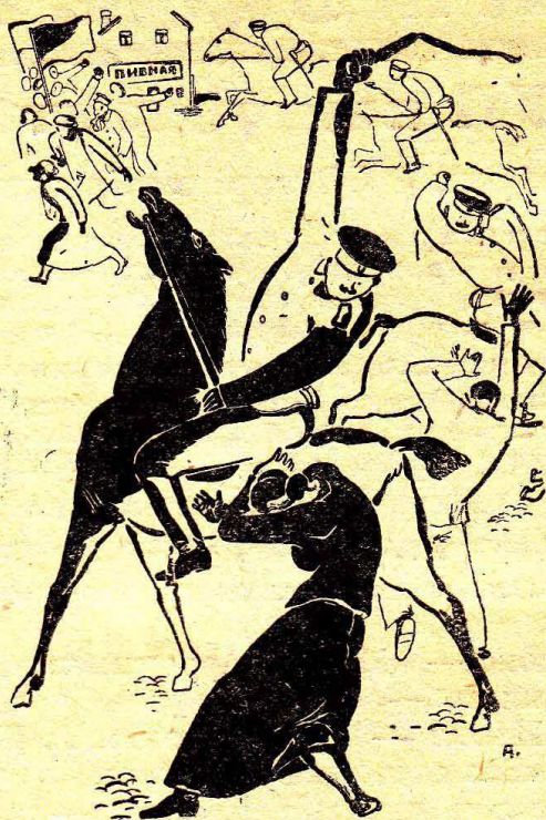
Из иллюстрации к «Седым дням» Г. Никифорова худ. Е. Авилгани

План ДБО на 1931 год построен так: из 44 названий—14 произведений современных советских писателей. (Из них 8 авторов РАППа и 6 попутчиков). Среди советских авторов: Горький, Ставский—«Разбег», Шолохов—«Тихий Дон», Панферов—«Бруски», Фадеев—«Последний из Удэге», Эрдберг—«Ки-