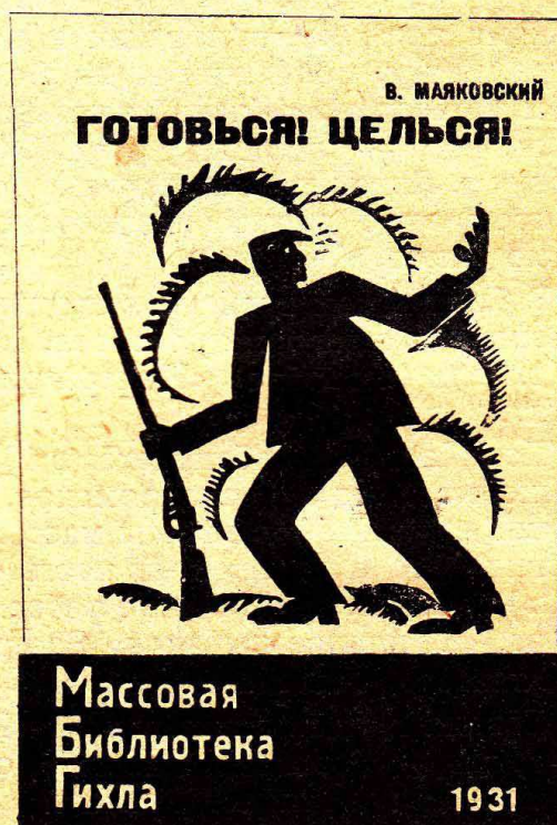
Рисунок на обложке В. Маяковского

Задачи, стоящие перед «Массовой библиотекой», определяют и авторский состав и тематику ее. По ориентировочному редакционному плану на 1931 год, 86,14% листаж «Массовой библиотеки» падает на современную советскую, а 13,86% — на иностранную революционную литературу. В свою очередь листаж, отведенный на советскую литературу, на 80,5% представлен произведениями пролетарских писателей, на 6% произведениями попутчиков и на 1,8% продукцией членов ВОКП. Если две первые цифры не нуждаются в комментариях, то последняя печально свидетельствует о том, что нынешняя продукция ВОКП чрезвычайно отстала от требований массового читателя. Редакция массовых серий предполагает в ближайшее время, совместно с рабочим редакционным советом ГИХЛа созвать совещание пролетарско-колхозных писателей по вопросу о массовой литературе для колхозников. Около 30% всего листаж массовой литературы идет на сборники произведений рабочих ударников и колхозников.